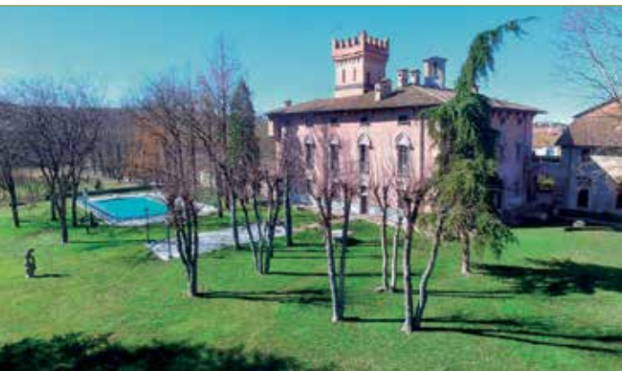
Un castello (senza fossato ma con piscina) in vendita

Per alcuni "fortunati" questi luoghi possono diventare residenze permanenti.