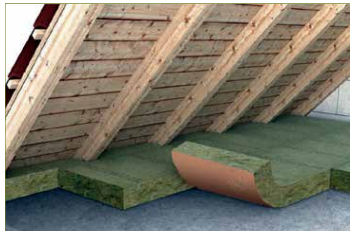
Lavori di isolamento nel sottotetto

Oggi, qualsiasi dispositivo tecnologico, elettrodomestico o bene immesso nel mercato deve possedere determinati requisiti inerenti il risparmio energetico. Allo stesso modo anche la mobilità sta cambiando, soprattutto nelle grandi città si sta sviluppando il concetto di mobilità sostenibile ovvero un nuovo modello basato su soluzioni innovative. Tutti questi cambiamenti hanno un fine comune ovvero ridurre l'inquinamento