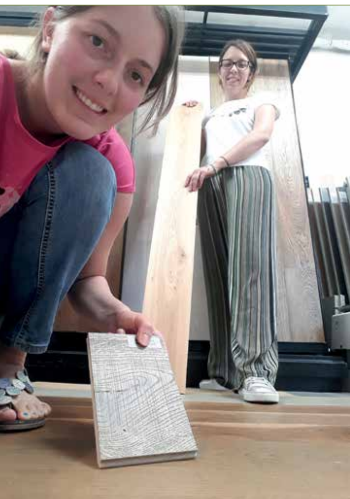
Le sorelle Faraon

Un'ampia scelta di pavimenti e rivestimenti per la casa adattabili ad ogni tipo di esigenza